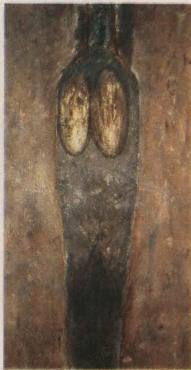
"Corpo femminile" (1983) di Sergio Ragalzi

● Ugo Nespolo. Salone della Renault, via Nazionale 183/b, fino al 12 novembre. Diciotto recenti dipinti ispirati ai videogames di un collaudato maestro astratto fanno da contorno alla grande opera intitolata "Il Museo" già esposta in altre numerose sedi italiane e straniere.