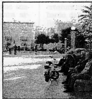
Una veduta di Triggiano