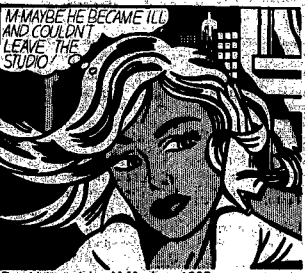
Roy Lichtenstein «M-Maybe», 1965

Pop Art in grande stile dalla collezione Sonnabend