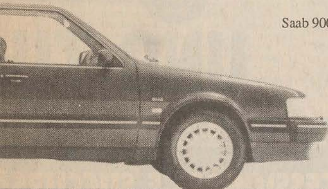
Saab 9000 CD