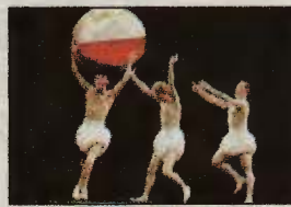
Una scena dello show