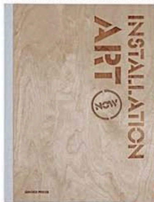
AA. VV., INSTALLATION ART NOW

Territori del cinema I multisala avanzano implacabili, ma questo meritevole libro va controcorrente e sottolinea il valore sociale e culturale di tutti i cinema a sala singola ancora attivi in Puglia. Tra nostalgia e film non blockbuster (Gangemi, 860 pp., € 130, www.gangemieditore.it ).