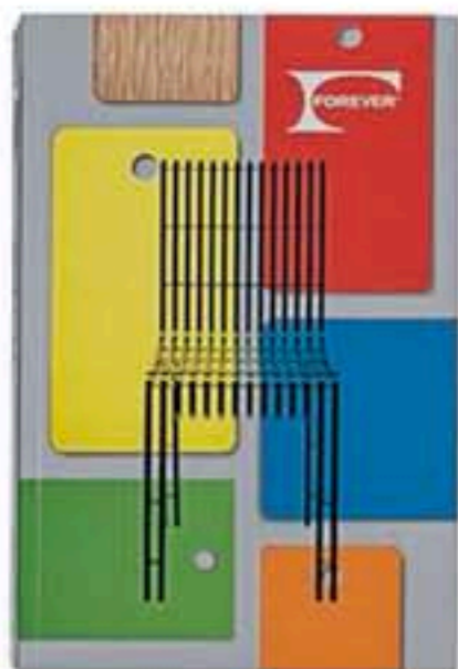
AA. VV., FORMICA FOREVER