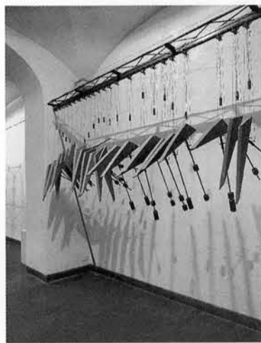
244 – G. GAZZOLA veduta parziale dell'allestimento