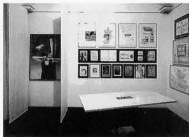
237 – veduta parziale dell'allestimento