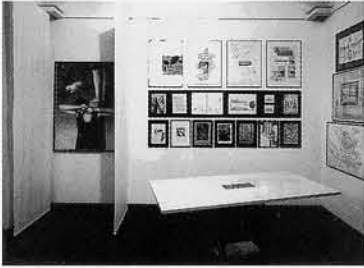
237 - veduta parziale dell'allestimento foto F. Fioravanti