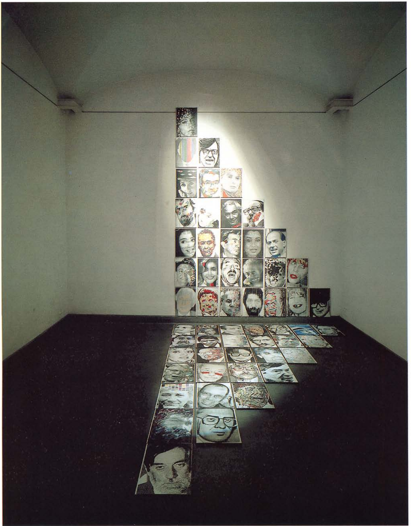
238 – Mario SASSO Visionica , 1995 videoinstallazione Galleria A.A.M./Architettura Arte Moderna