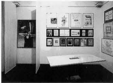
237 – veduta parziale dell'allestimento