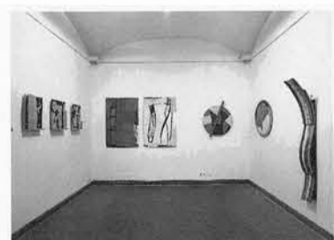
245 – T. CASCELLA, G. MARINI veduta parziale dell'allestimento

A cura di Francesco Moschini. Testi in catalogo di Alberto Abruzzese, Yehuda Safran. Spiega Moschini nella prefazione al catalogo: «Il lavoro di Gianandrea Gazzola si presenta come paziente elaborazio-