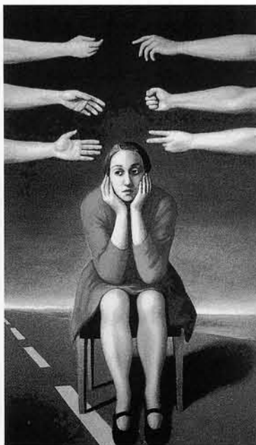
239 – P. GANDOLFI Corsia di sorpasso , 1992 olio su tela, cm 180x105

Paola Gandolfi presenta, nei locali di Palazzo Brancaccio, una selezione di opere relative al periodo 1991-1994, costituenti un nucleo di lavoro unitario nell'arco del suo itinerario artistico. E' dagli anni 90 infatti che l'artista comincia ad insistere sempre più sulla perentorietà d'immagine delle sue figure liberando il paesaggio da una precisa determinazione di tempo e di luogo. Afferma Moschi-