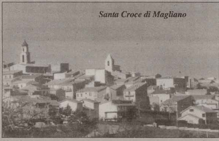
Santa Croce di Magliano