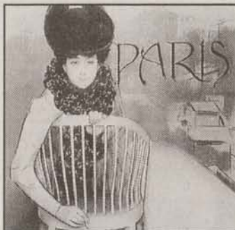
Casas: manifesto pubblicitario (Brescia, Palazzo Martinengo)