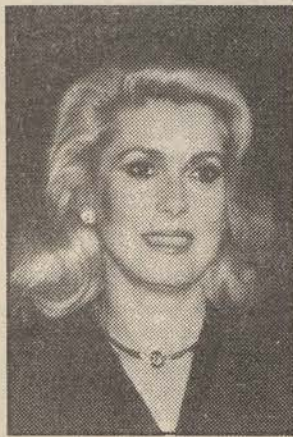
Catherine Deneuve «Le parapluies de Cherbourg»