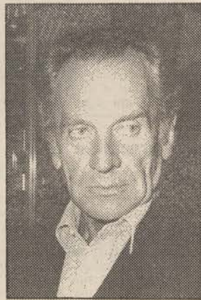
Massimo Girotti «Senso»

gradato e mandato a Fort Apache provoca uno scontro con i pellerossa e viene sconfitto sanguinosamente. Si salva sua figlia e un tenente innamorato di lei. Uno dei migliori western di Ford.