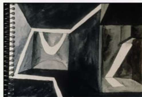
1. progetto per l'Archivio Francesco Moschini A.A.M. Architettura Arte Moderna ; 2. disegno per il progetto del Museo della città di Cassino, 1994; 3. Manifesto della mostra Steven Holl: Ponti e Progetti, A.A.M. Architettura Arte Moderna, 1981; 4. una veduta della mostra Steven Holl: Parallax, A.A.M. Architettura Arte Moderna, Milano, 2001; 5. una veduta della mostra Steven Holl: Su pietra, Castello di Acaya, 2010.