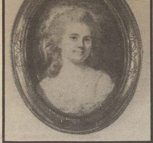
Qui sopra, una miniatura francese che fa parte della collezione delle miniature francesi e inglesi del XVIII e XIX sec. che verrà messa all'asta dalla Christie's da lunedì 7, accanto, olio su tela di Pino Caccamo «Stazione di buncheraggio» alla galleria La Gradiva

Alla galleria AAM, via del Vantaggio 12; tel. 3619151. Orario: 16,30-20; dal 23 e fino al 19 ottobre.