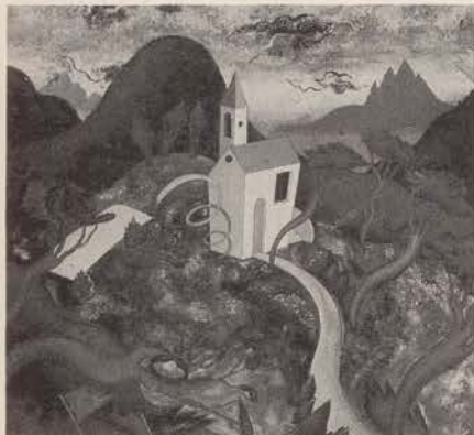
Si intitola "Collina rossa" questo acrilico su tela (misura 120 cm. x 120) di Luca Alinari: la mostra di Alinari si inaugura il 9 al Centro Ausoni.

● Studio Durante, via del Babuino 179; tel. 3619429. Orario: 17-20.