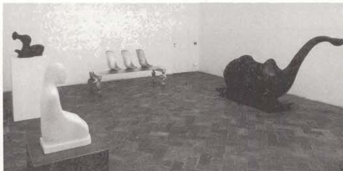
Saint Clair Cemin, courtesy Sperone.

□ Bellissima e di grande rigore la mostra di Andrea Fogli, intitolata "Stati", da Ferranti. L'artista ha esposto una serie di opere dall'apparenza immobile e silenziosa, ma fortemente "presenti", con una loro arcana e vigorosa compostezza, ed un particolare alone di inesplicabilità. Nonostante la loro matericità (questi