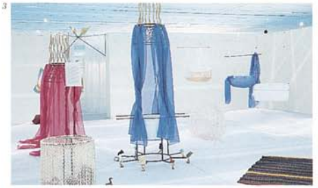
2-3-4: Ausblick der Handelsausstellung

BILANZ DES KULTURELLEN RAHMENPROGRAMMS: 418 Prototypen wurden von 291 Unternehmen vorgestellt, die in Zusammenarbeit mit 296 Architekten und Designern entstanden sind.